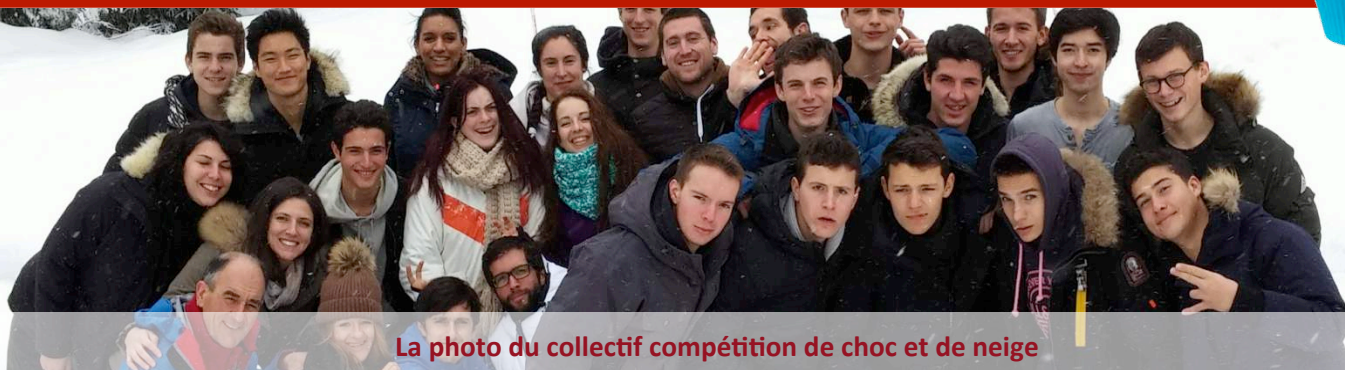
La photo du collectif compétition de choc et de neige